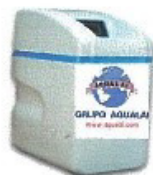
Perla 2 en 1