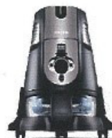
RoboClean 2 en 1